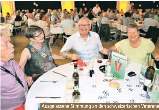
Ausgelassene Stimmung an den schweizerischen Veteranentagen: Links 2019 in Leukerbad und rechts 2022 in Pfäffikon SZ