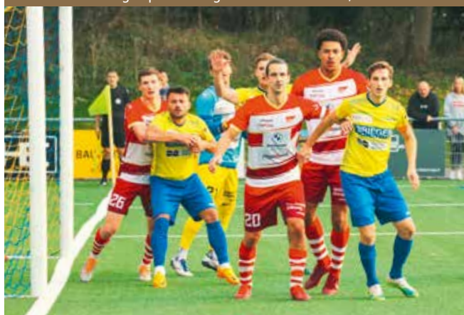
Szene aus dem 1. Liga-Spiel FC Langenthal – FC Solothurn, Herbstanlass 2022