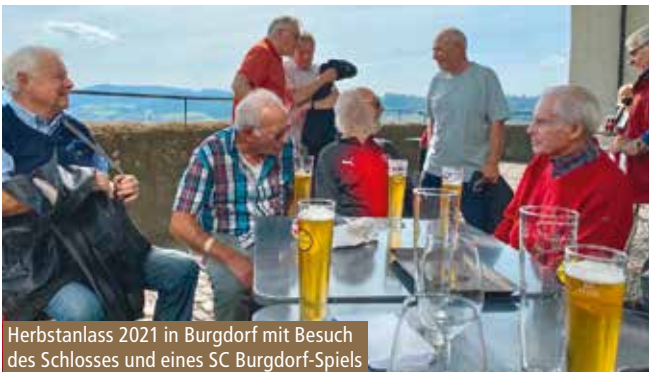
Herbstanlass 2021 in Burgdorf mit Besuch des Schlosses und eines SC Burgdorf-Spiels