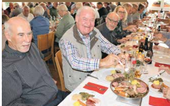
Surchabis-Plausch vom 20. November 2021 im Rest. Löwen Berken