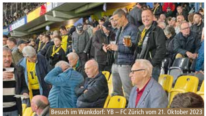
Besuch im Wankdorf: YB – FC Zürich vom 21. Oktober 2023