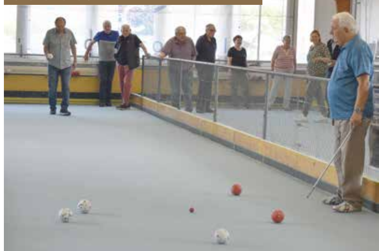
Der beliebte jährlich stattfindende Boccia-Plausch in Kirchberg, hier vom 6. Mai 2023