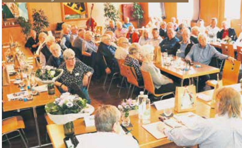
Hauptversammlung vom 12. März 2022 in Restaurant Sternen Zollbrück