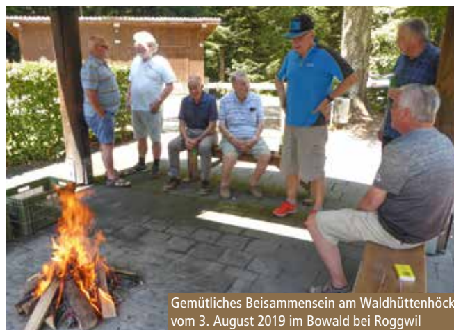
Gemütliches Beisammensein am Waldhüttenhöck vom 3. August 2019 im Bowald bei Roggwil